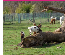
Zoo de l'Auxois