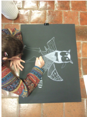
Atelier du musée de Semur-en-Auxois

Tous les après midis de 14h à 18h sauf le mardi avec du 1er juin au 30 septembre ouverture de 10h à 12h30 lundi, mercredi, jeudi, vendredi.