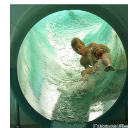
Centre aquatique Amphitrite - Montbard

Tarifs (la séance) : adultes 5€, enfants de 3 à 18 ans 3.50 €, gratuit -3 ans. Soirée découverte : chaque mercredi à 18h : 2.50 €