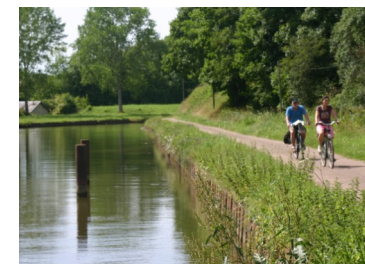
La véloroute le long du Canal de Bourgogne

Balade détente au bord de l'eau sur la véloroute du canal de Bourgogne. Un sentier et des boucles aménagés vous permettent d'aller découvrir autrement le patrimoine naturel et les activités et visites aux abords du canal. Alors enfourchez votre vélo ou contactez les différents loueurs qui parsèment le pays de l'Auxois (voir brochure Guide de l'Auxois/activités de loisirs).