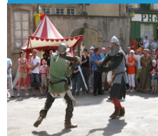
Les médiévaux de Semur-en-Auxois