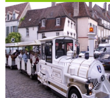
Le petit train de Semur-en-Auxois