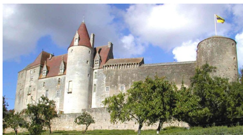
Château de Châteauneuf-en-Auxois