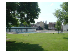
Piscine de Saulieu